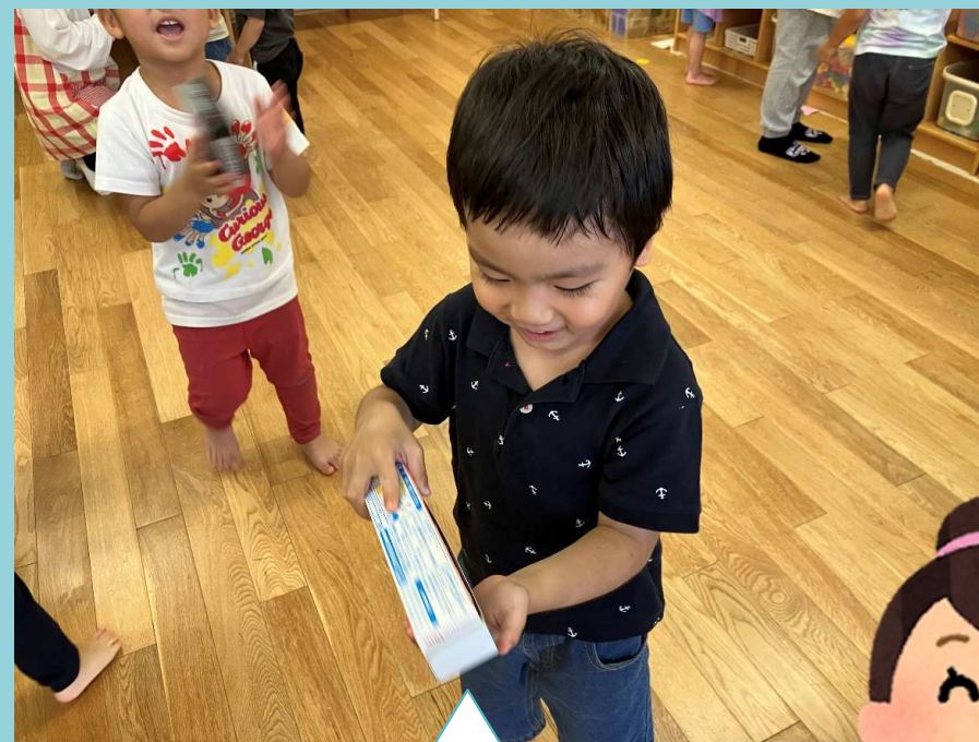
ラップの入れ物にペットボトルのキャップを入れて 風の音を表現