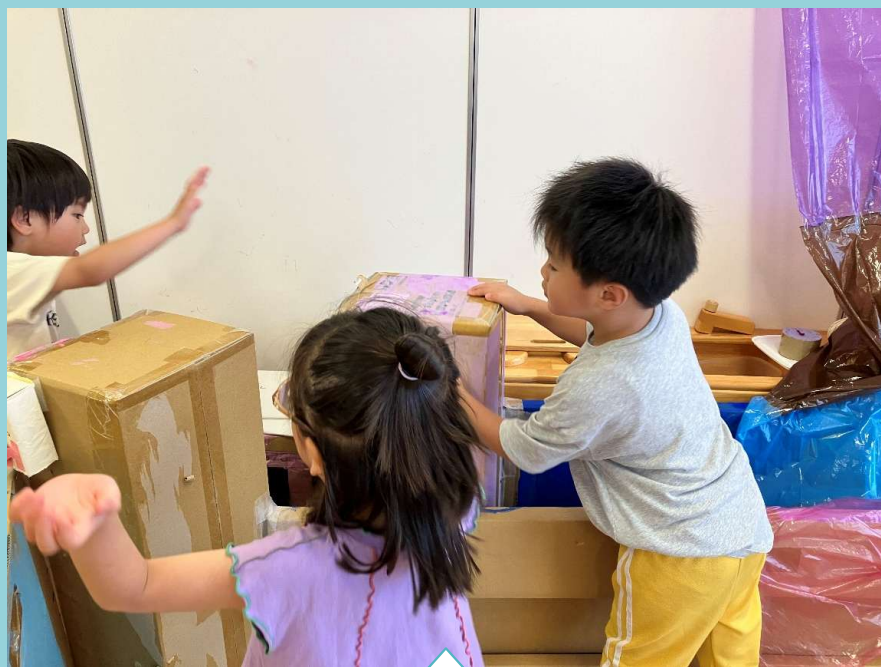
段ボールを叩いて電車の音を表現